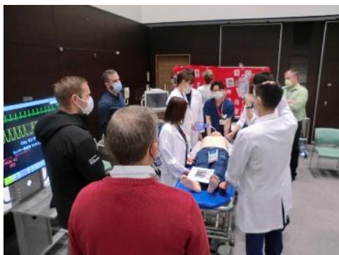
UNM Simulation Lecture