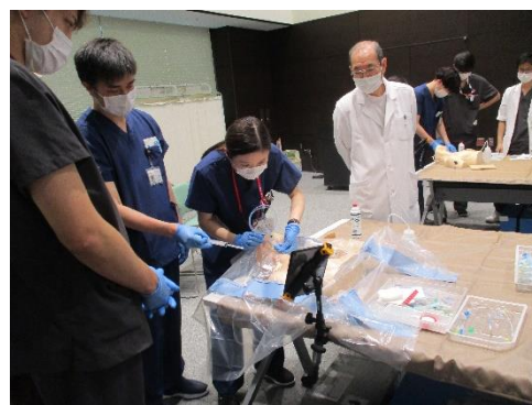
CVCハンズオンセミナー