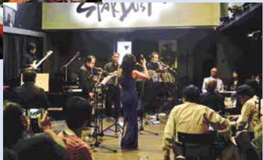
▲定禅寺ストリートジャズフェスティバル（せんだいメディアテーク）での演奏